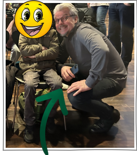
Autor Martin Baltscheit

Als es zu Ende war, haben die Kinder ein Geschenk bekommen. In dem Geschenk war eine Warnweste und Tic-Tac-Toe.